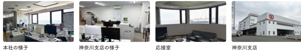
本社の様子 神奈川支店の様子 応接室 神奈川支店

本社は習志野市茜浜の大日ロジ倉庫内に、神奈川支店は関東物流センター内に拠点を置き、グループ施設を生かした運営と働きやすい職場づくりに取り組んでいます。《 鎌田社長からのコメント 》