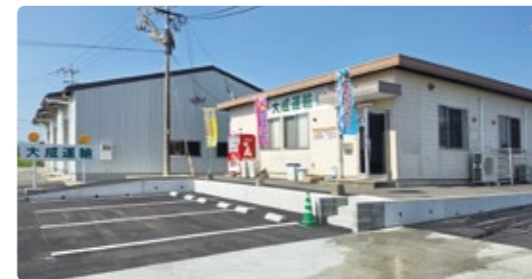
大成運輸(株) 行橋営業所が併設